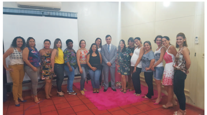
Coxim - MS