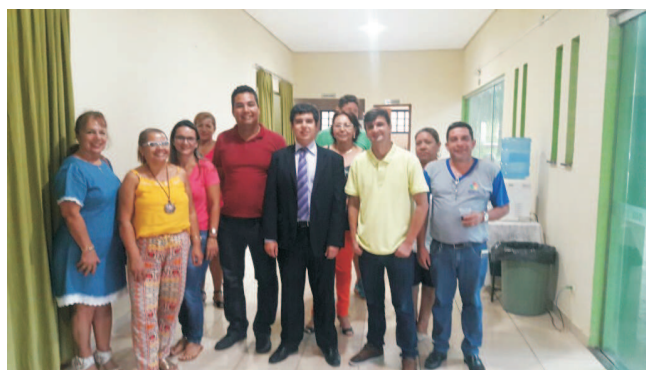
Terenos - MS