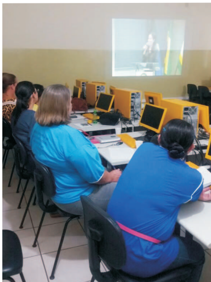
Rio Negro - MS