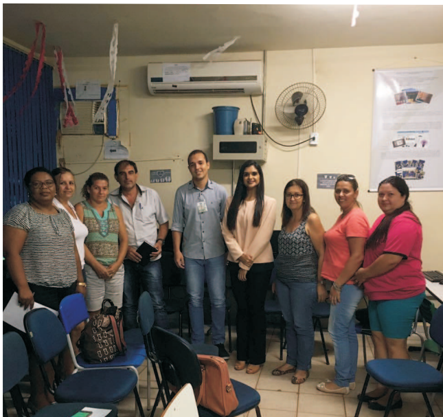
Angélica - MS