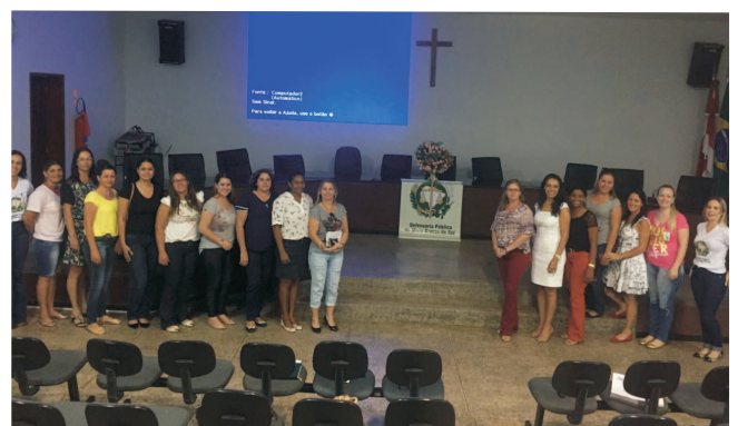
Mundo Novo - MS