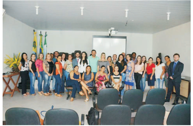
Costa Rica - MS