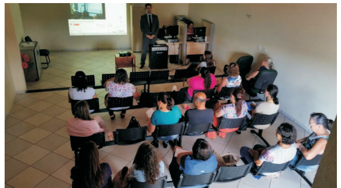
Maracaju - MS