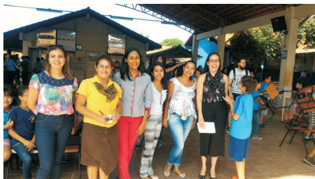
Na foto: equipe psicossocial do NUDEM, equipe da E.M Nagen Jorge Saad e a Defensora Pública no momento em que era questionada por um aluno sobre a reforma da previdência e como afetaria as mulheres.

O NUDEM segue com o projeto de educação em direitos durante todo o ano, para solicitação de palestras ou capacitações envie-nos um e-mail para: nudem@defensoria.ms.def.br