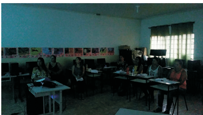
Bandeirantes - MS