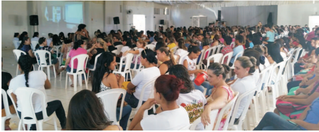
Amambai - MS