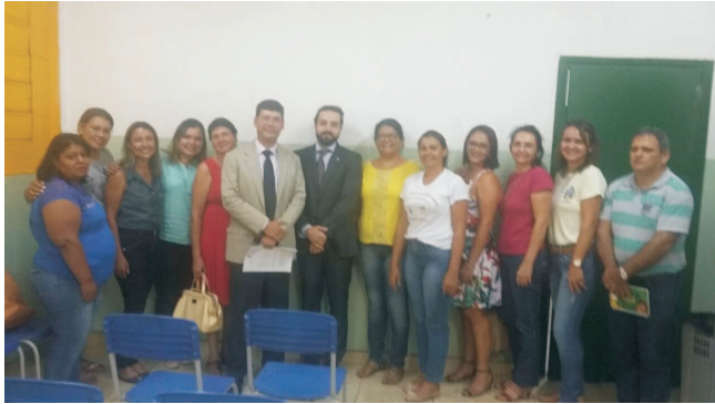
Anastácio - MS