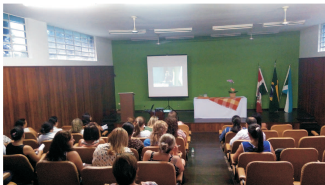
Rio Verde de Mato Grosso - MS